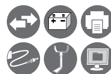
AKCESORIA NA STRONACH 71-74